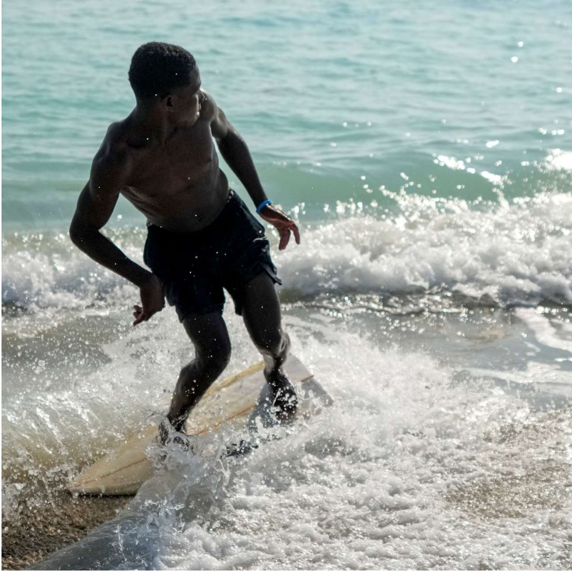
LOCAL GUY SURFING WITH A BROKEN SURFBOARD