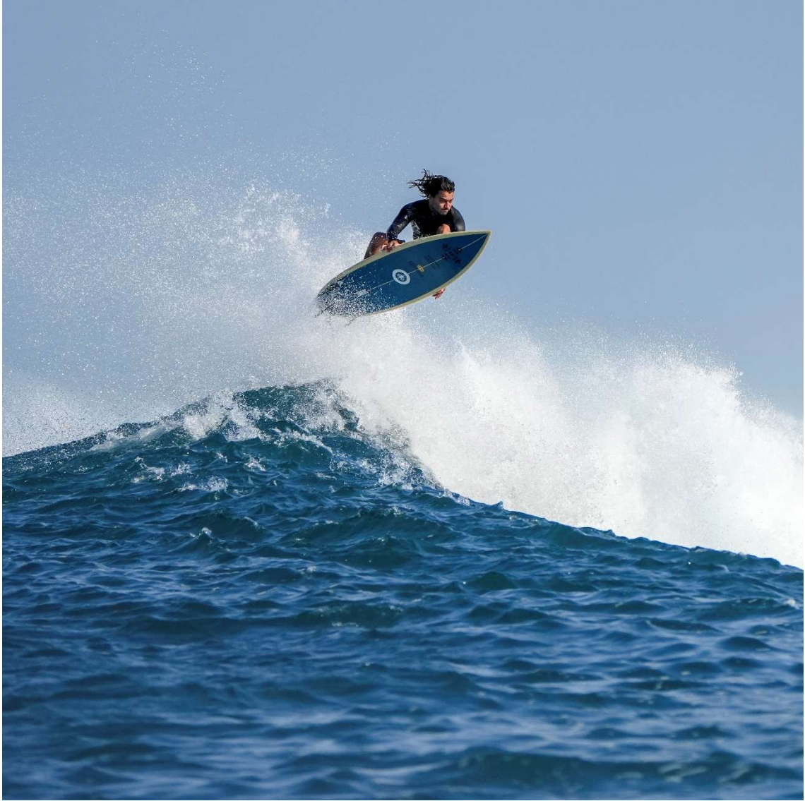
AIR BY MIGUEL BLANCO