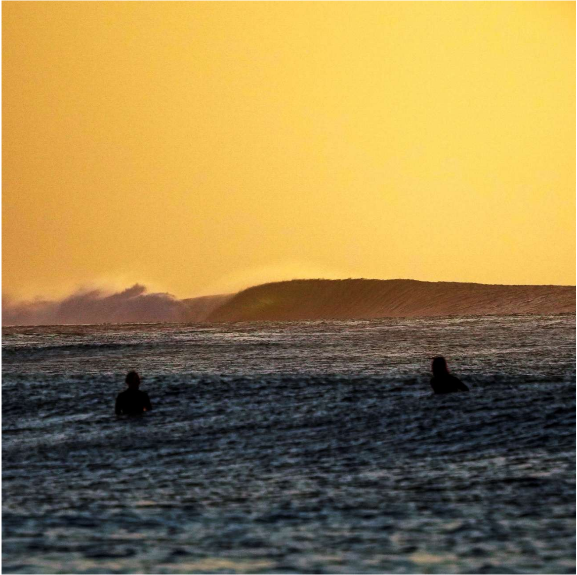
KEPA ACERO AND MIGUEL BLANCO WAITING FOR THE TRAIN